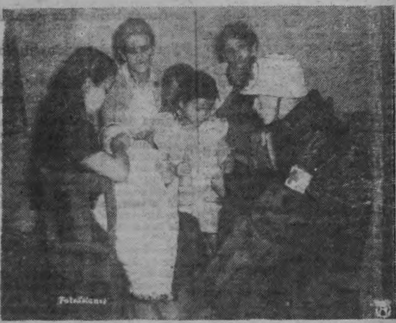
Otra de las familias afectadas por la inundación en San Rafael de Tres Ríos.

El caudal de los ríos La Cruz y Tiribi decrecieron y poco a poco se fué regulando la situación