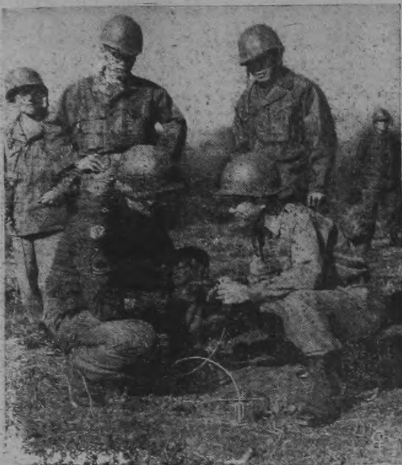
El Sargento Carl Hodges (a la izquierda) instruye al Capitán Cho Sung Chan, Oficia Coreano, sobre la manera de hacer las conexiones eléctricas de una carga de demolición en el Fuerte de Belvoir (Estado de Virginia).

Más de 700 Oficiales Sudcoreanos están estudiando actualmente la técnica moderna militar en los famosos centros de entrenamiento del Ejército que hay en los Estados Unidos.